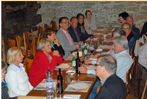
KF aus der