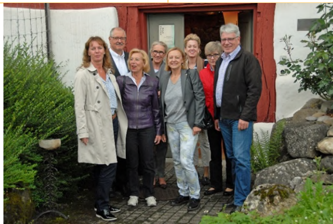
Die fröhlichen Teilnehmenden