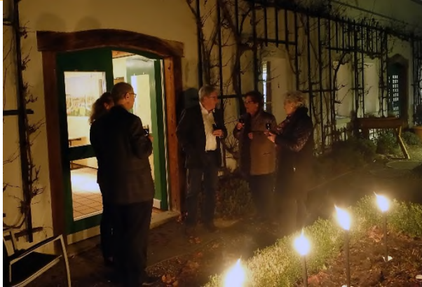
Der Apéro findet im Garten statt.