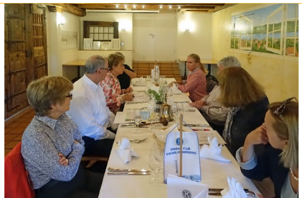
Der geschäftliche Teil