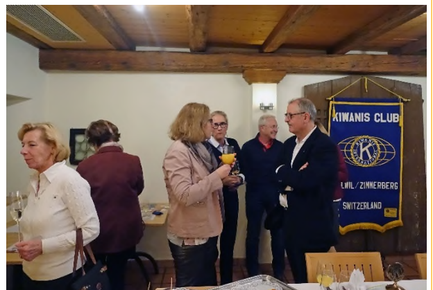
Die Geburtstagsgesellschaft beim Apéro