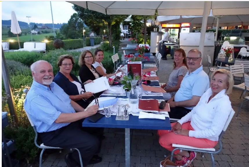
Gemütliches Zusammensein und Nachtessen