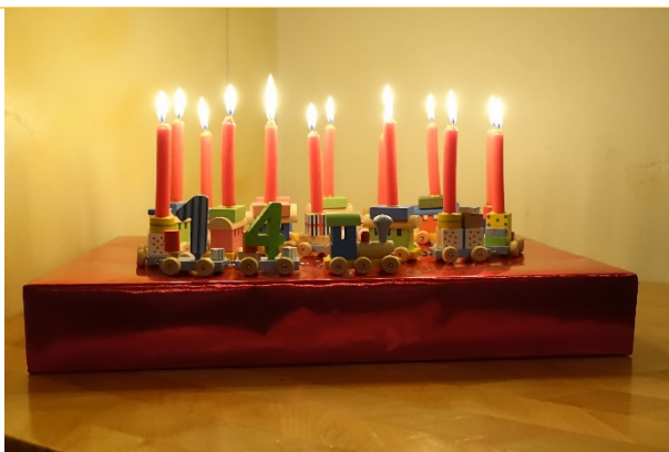
Die Kerzen leuchten auf dem traditionellen Zug zum 14. Geburtstag