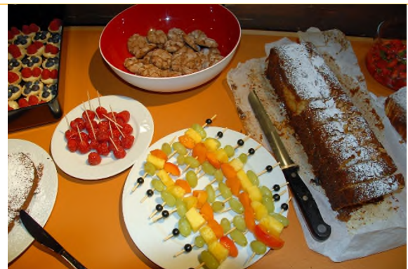
Das verführerische Dessertbuffet