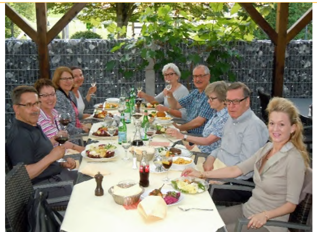
Die Wandergruppe im «Schwyzerhüsli» Horgenberg