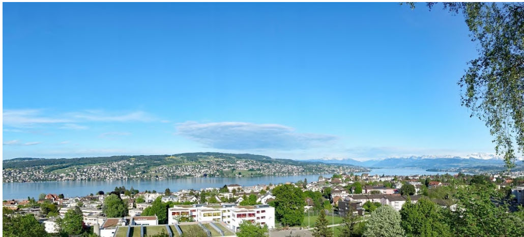
Fantastische Sicht vom Etzliberg