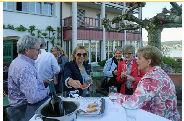
Apéro im Garten