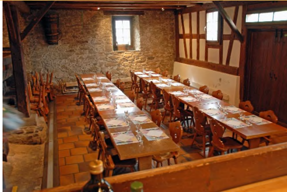
Die Trotte Thalwil ist für die Gäste bereit.