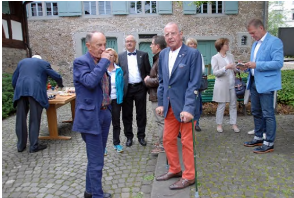
Apéro im Hof der Trotte

Viele Helfer und Helferinnen haben diesen Anlass organisiert. KF aus der Division nehmen teil. Der Reinerlös aus den Lottogängen wird dem Divisionsprojekt «Ear for Nepal» gespendet.