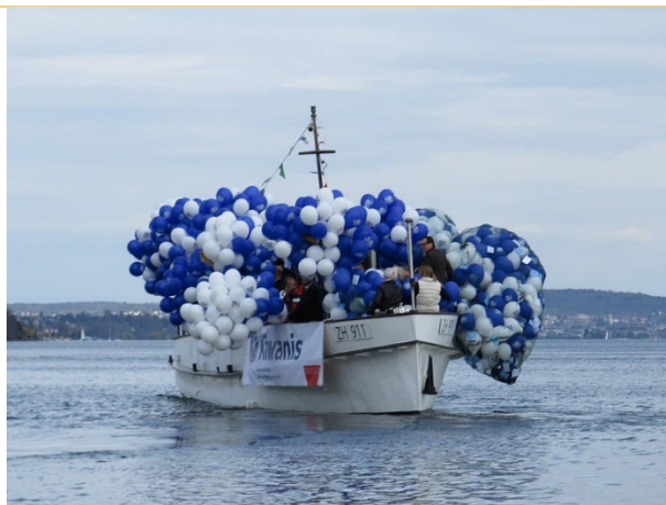
Das Schiff fährt vollbeladen bis in die Seemitte,