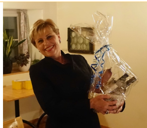
Lauras Präsidium wird verdankt