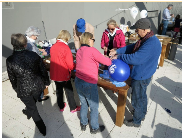
Die Ballone werden vorbereitet

Anlässlich des 100. Geburtstages von Kiwanis International werden um 11 Uhr 30 auf einem Schiff in der Seemitte auf der Linie Horgen-Meilen 1500 Ballone steigen gelassen. Mit dem Verkauf der Ballone ist das Projekt Eliminate unterstützt worden.