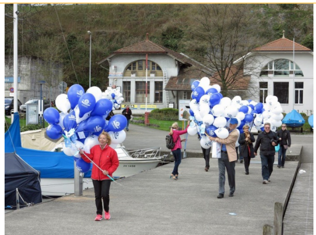
und an Bord des Schiffes gebracht