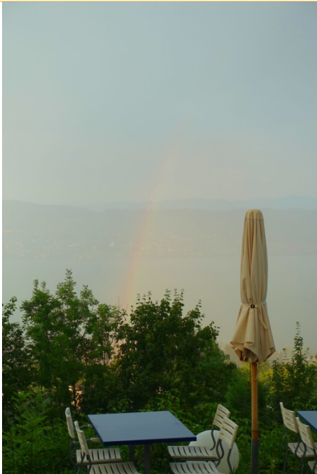
Regenbogen über dem Zürichsee

Regen und Sturm verhindern auch dieses Jahr das Minigolf-Spielen. Ein Regenbogen, gemütliches Zusammensein und feines Essen prägen den Anlass.