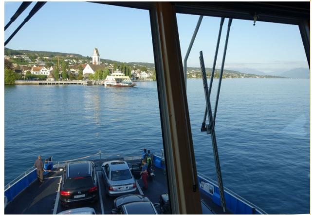
Ankunft in Meilen