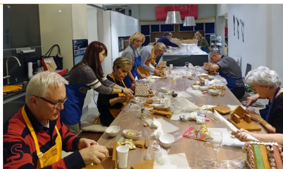
Das Team an der Arbeit