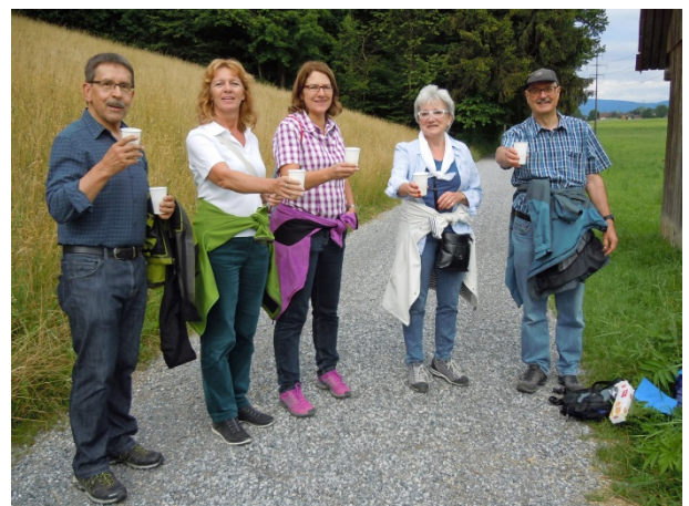
Der Apéro wird von den Teilnehmenden geschätzt.