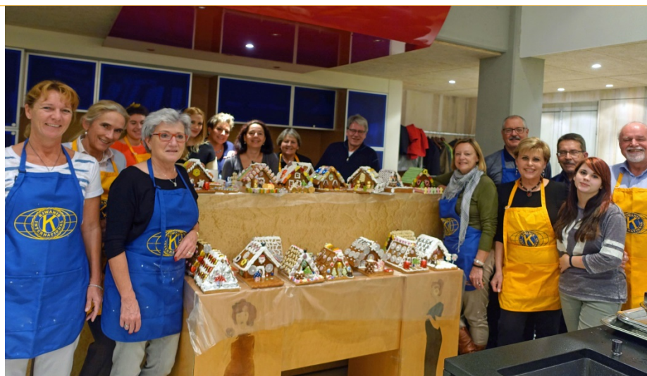
Das Team nach getaner Arbeit