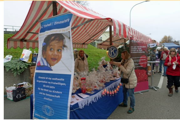
Der Markt am Nachmittag und...