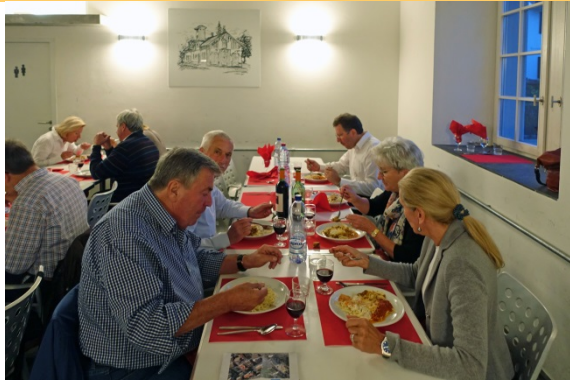
Auch Lt Governor Werner Häberling nimmt am Anlass teil.