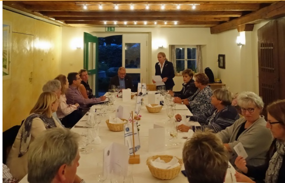
Die Versammlungsrunde im Etzliberg

Die Ämter werden den neuen Amtsträgern und –trägerinnen übergeben, Mitglieder verdankt für Ihren Einsatz.