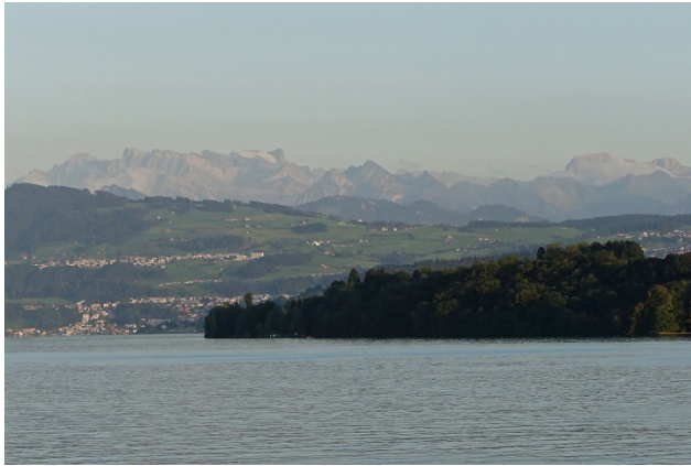
Abendstimmung während der Fahrt