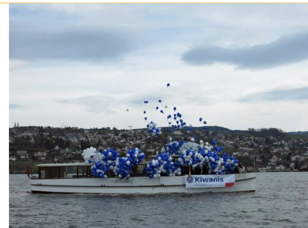
wo die Ballone in die Luft steigen