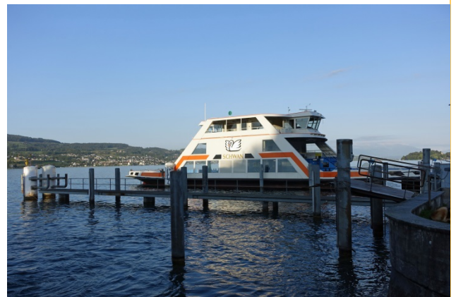
Die Fähre «Schwan», eines der fünf Schiffe