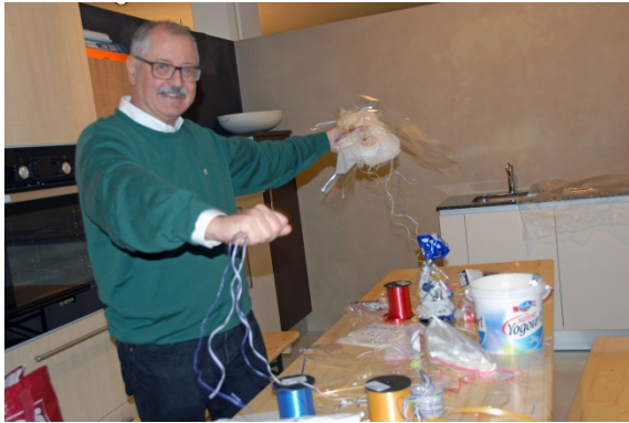
Norberts Kampf mit den Bündeln