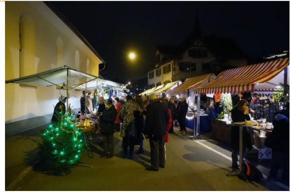
... am Abend