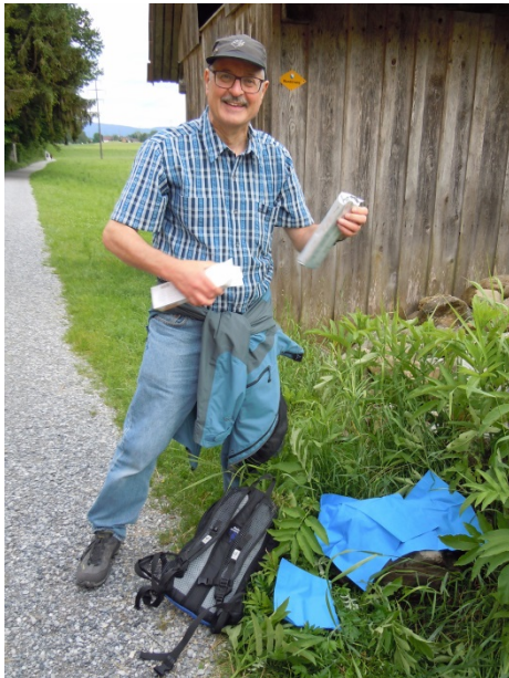
Norberts Utensilien für den Apéro