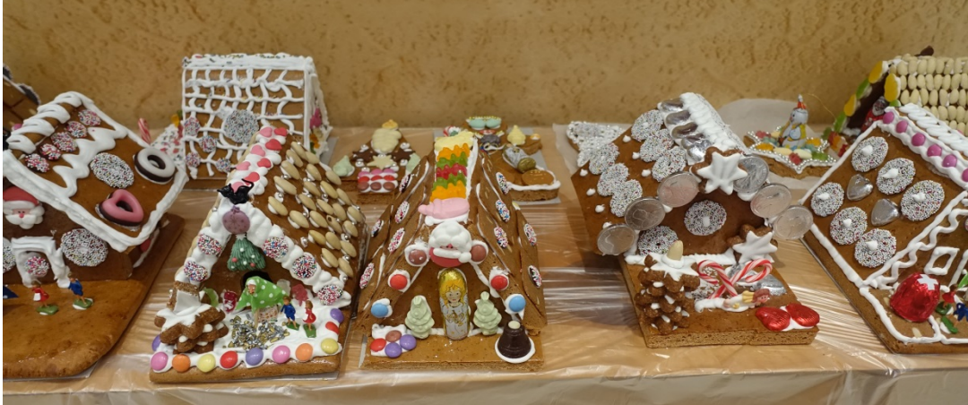
Die fertigen Lebkuchen-Häuser, -Herzen und Sterne