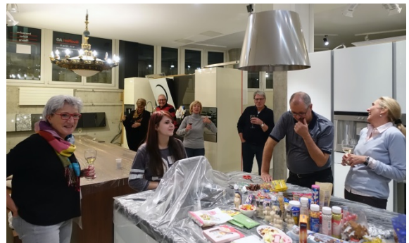
Auch die Gemütlichkeit kommt nicht zu kurz.