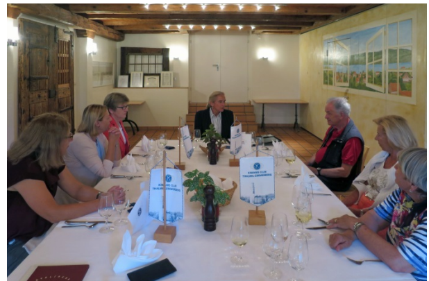
Die Gesprächs- und Tafelrunde