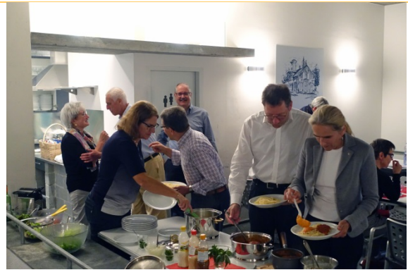
Saucen und Desserts findet Anklang.